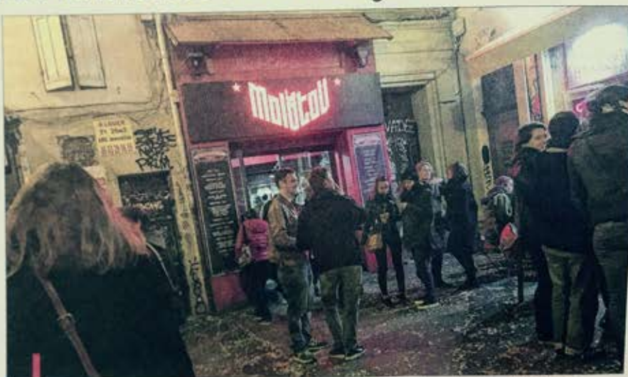
Le public est arrivé au fur et à mesure que les artistes défilaient sur la scène du Molotov.

Un autre concert en hommage aux victimes est désormais très attendu : le 21 décembre, IAM montera sur la scène de l'Espace Julien en même temps que Keny Arkana, Sat l'Artificier, Faf Larage, 3 e Œil ou encore K-Rhyme Le Roi.