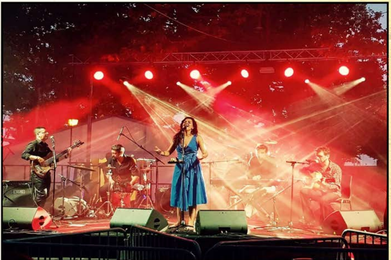
Première partie de Sergent Garcia, Fête de la musique 2018, Port de Bouc

Une énergie et une vraie sensibilité au service d'une musique volcanique qui ne laisse personne indifférent.