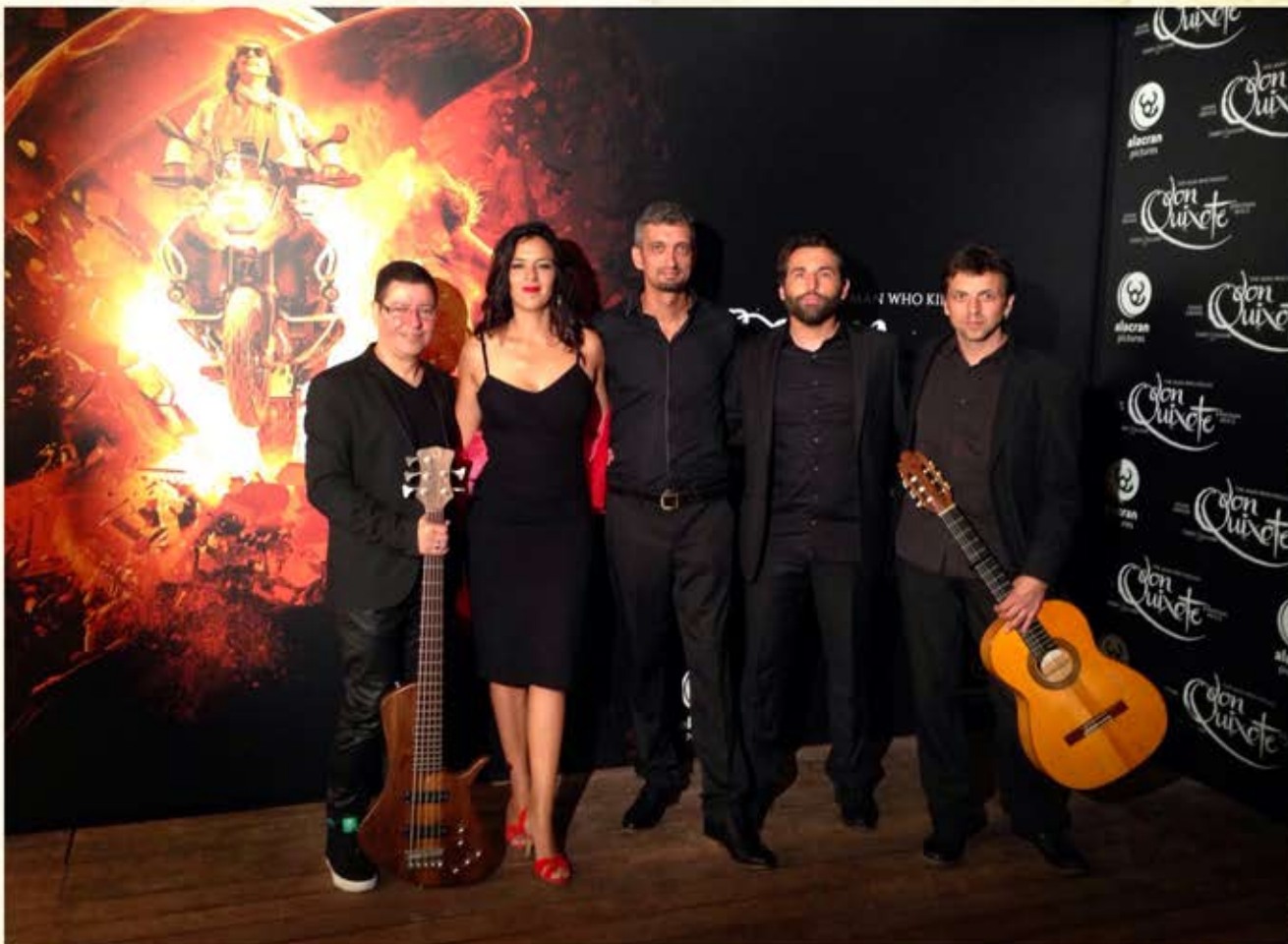
Piel canela Groupe officiel de la soirée de cloture du festival de Cannes 2018 pour la sortie du film «L'homme qui tua don Quixote» de Terry Gilliam.